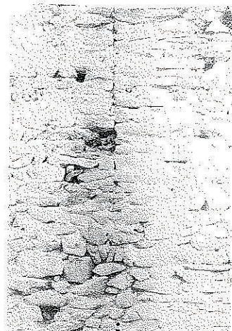
C. Particolare del punto di contatto tra M2 e C2.