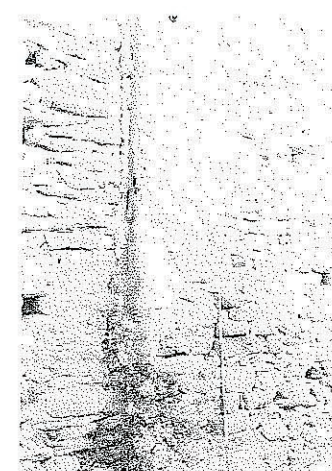
E. Particolare del setto murario M3 costruito a tamponare lo spazio esistente tra le due cellule C2 e C3.