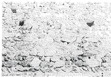
B. Particolare della muratura nel tratto M2.