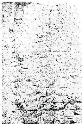
A. Particolare della muratura nel tratto M1.