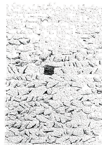
D. Particolare della muratura della cellula C2. Visibile in alto a destra la finestra rettangolare ora tamponata.