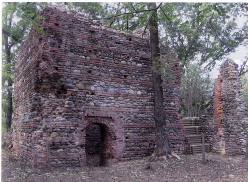
(FIG. 9) Druento, castello di Rubbianetta

I casi studio presentati condividono poi una serie di altri problemi che, affrontati alla scala del singolo comune committente, pongono sempre difficoltà: l'equilibrio nella previsione di spesa tra scavo, conservazione e musealizzazione; la difficoltà del calcolo previsionale degli interventi archeologici; l'accessibilità al pubblico dei siti (sentieristica, parcheggi, servizi) e la loro messa in sicurezza (recinzioni, percorsi ecc.) 20 . Sebbene maturate in contesti diversi, le esperienze accumulate nell'ultimo decennio cominciano a costituire un utile repertorio di pratiche che meriterebbero ulteriori approfondimenti critici e operativi. La condivisione non solo della comunicazione turistica - obiettivo ultimo, forse troppo remoto, degli interventi -, ma anche dei nodi di fondo tecnici e scientifici pare essere l'unica logica che consenta sia di concludere i cantieri, sia di mantenere i siti in vita, ma soprattutto di collegarli con il territorio e di inserirli nel dinamismo del paesaggio.