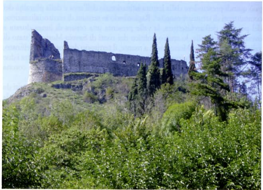
(FIG. 1) Avigliana, castello

Tra i casi qui considerati si riscontrano fenomeni di distruzione bellica sistematica e volontaria (Avigliana, Tur d'Amun di Bardonecchia) e casi di abbandono lento e di 'smontaggio' progressivo degli elementi di pregio o di frequentazione (Condove, Sant'Ambrogio, Oulx): entrambe le modalità di dismissione implicano il difficile reperimento di strati di frequentazione significativi, come pure di testimonianze di vita quotidiana e di componenti edilizie di pregio. A Bardonecchia, grazie all'interpretazione metrica delle foto precedenti il bombardamento degli anni Quaranta, è stato possibile calcolare preventivamente la massa di macerie che ricoprivano la stratificazione archeologica; l'analisi delle fonti trecentesche ha invece consentito di prevedere la complessità del sito del castello (dimenticato dalla storiografia locale), mentre le indagini di superficie hanno focalizzato le aree di maggior potenzialità, secondo la necessaria complementarità tra fonti scritte e materiali.