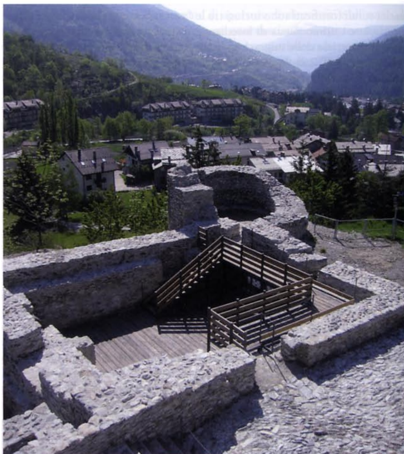
(FIG. 8) Bardonecchia, parco archeologico della Tur d'Amun