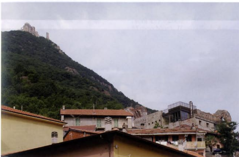
(FIG. 10) Sant'Ambrogio, castello abbaziale; sullo sfondo, la Sacra di San Michele