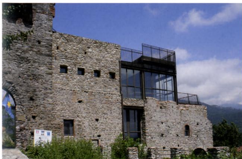
(FIG. 6) Sant’Ambrogio, castello abbaziale

Pare utile una chiarificazione del concetto di “sistema”: non tutti i manufatti simili architettonicamente (ruderi medievali) o prossimi spazialmente possono essere considerati parte di un unico sistema storico di difesa. Anzi, la presenza di fortificazioni promosse da soggetti diversi (comitali, reali, abbaziali, signorili locali) e sviluppatasi come esito di una pluralità di processi di costruzione e di abbandono consente di individuare valenze interpretative e progettuali aperte ai sistemi storico-culturali più diversificati. Da tale approccio consegue un’accezione più matura del concetto di “contesto”: non solo gli spazi prossimi al manufatto (quali che siano: bosco, piazza, chiesa o altri monumenti, sebbene privi di nessi storico-culturali con esso), ma la complessa rete delle relazioni che conferiscono significato culturale a un manufatto, individuate anche in aree geograficamente remote, secondo tematismi più ampi spazialmente, ma al tempo stesso più selettivi (ad esempio: patrimoni religiosi o familiari, amministrazione di un ente territoriale storico, sistemi stradali). Tale accezione implica la necessità di una cooperazione più impegnativa tra amministrazioni pubbliche ed enti di ricerca nelle attività di valorizzazione, ma offre chiavi interpretative e progettuali più forti e più facilmente comunicabili, l’inserimento delle iniziative locali spontanee o