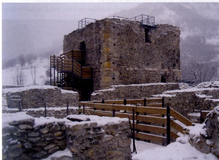
(FIG. 2) Bardonecchia, parco archeologico della Tur d'Amun

I comuni investono risorse proprie, ma raccolgono fondi strutturali (DocUP 1997/1999 ob.2, mis. 2.2 e 2000/2006 ob. 2.5.b per Bardonecchia, Condove e Sant'Ambrogio), contributi per reti di comuni sulla LR 4/2000 sul turismo ( La ciclostrada segreta del diacono Martino e L'Anello Forte per Condove, 2006 e 2008) e sulla LR 34/2006 sul turismo religioso (struttura ricettiva a Sant'Ambrogio), contributo LR 58/1978 sulle attività e sui beni culturali (Sant'Ambrogio circuito panoramico), fondi per i Giochi Olimpici invernali e Piano Integrato d'Area Torino 2006 (Sant'Ambrogio, Oulx e Bardonecchia), cofinanziamenti di fondazioni bancarie (Compagnia di San Paolo per Sant'Ambrogio e aree esterne di Bardonecchia), interventi regionali ( antiquarium di Varisella) e Accordo di programma tra Regione Piemonte e Ministero dell'Ambiente (Rubbianetta). Anche la Soprintendenza archeologica è intervenuta con proprie risorse per completare il restauro dei reperti mobili di Varisella, ma soprattutto offre il suo contributo attraverso la direzione scientifica dei cantieri di scavo e restauro, che rimane il proprio inderoga-