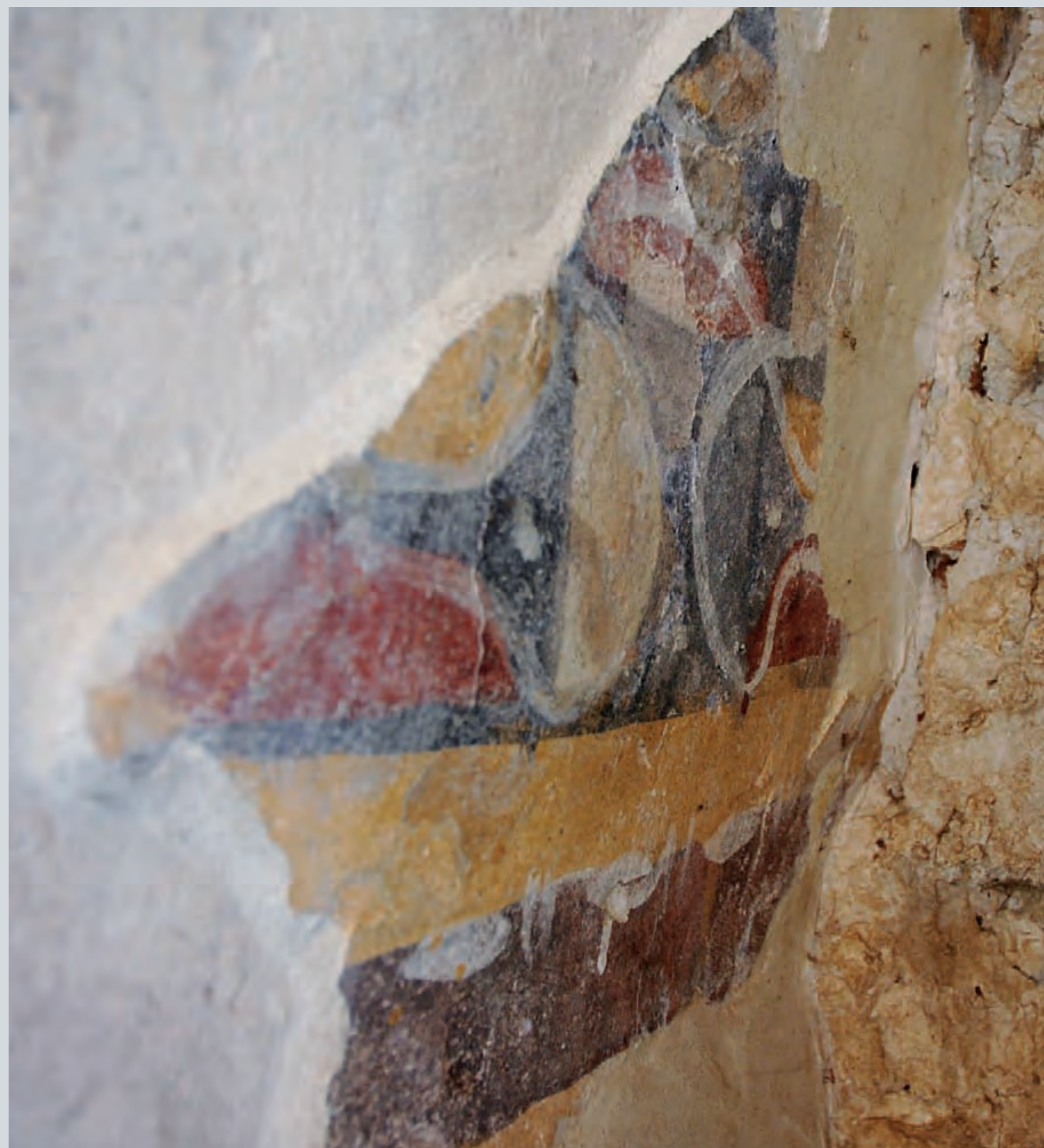
figura maschile nuda, in funzione di telamone, che mostra di reggere il peso dell'architettura sovrastante. Il bordo curvilineo del capitello è inoltre sottolineato da un motivo a tralci dai colori molto vivi, blu, giallo, rosso, così come acceso è l'incarnato del telamone,

Segue, procedendo verso l'alto, un frammento riquadrato in basso e a destra da una fascia gialla; lo sfondo del frammento è bianco, e su tale sfondo si staglia una figura di santo a mezzo busto: ne rimane una